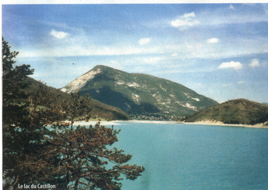
Le lac du Castillon

le village par une marche d'environ 2 heures 30. Le chemin a été restauré mais le dénivelé reste hélas de 210 mètres... La descente est nettement plus facile". On comprend pourquoi le monde entier adore la Belgique.