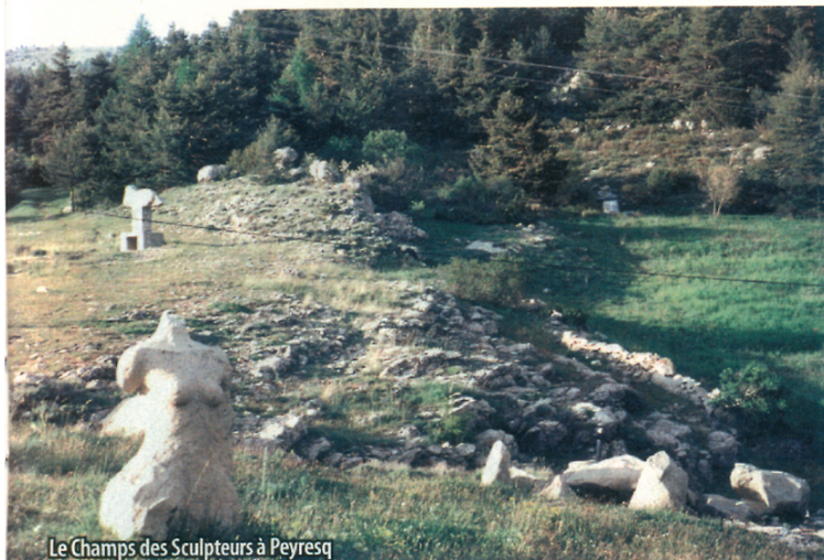
Le Champs des Sculpteurs à Peyresq