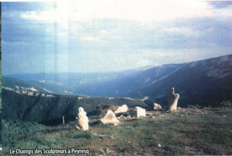
Le Champs des Sculpteurs à Peyresq

Il y en avait partout, sur les chaises, sur les tables, sur les lits, on marchait, on s'asseyait, on dormait sur les bouquins avec pour compagnons deux douzaines de chats". Nos archives nous apprennent en outre qu'il entretenait chez lui un graveur, un sculpteur, un peintre et un relieur chargés de reproduire ses dessins et mettre au clair ses écrits sur la botanique, l'astronomie, l'archéologie, la jurisprudence... Quel extraordinaire puits de science ! On comprend mieux maintenant les motivations de tous ces professeurs et étudiants de l'Université libre de Bruxelles et de quelques autres prestigieuses académies. Outre les séminaires scientifiques et les stages artistiques et littéraires, des conférences "grand public" sont régulièrement proposées. Quelques titres en 2005 : "Origine de l'Univers et l'année Einstein",